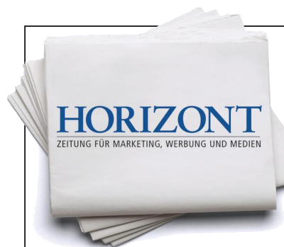
ILLUSTRATION: PIXEL-ROBOT / FOTODIA

BRONZE: Die Qualität ist hoch, die Jury bleibt dennoch streng. Erste Sieger. 22