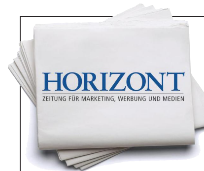
ILLUSTRATION: PHILIPPOFF / GOROUA

WACKEN OPEN AIR: Das Festival von Metal und Marken ist zurück. 20