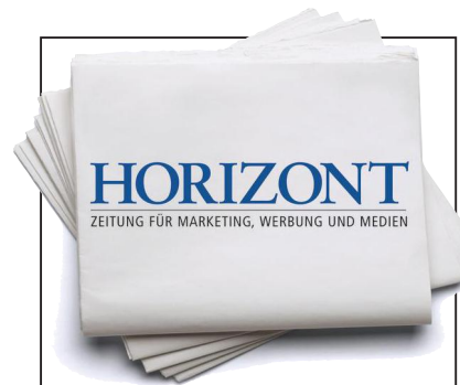
ILLUSTRATION: PIRELLA GÖTTSCHE LOWE

TIKtok: Wie die Bahn und andere Unternehmen die Zielgruppe umgarnen 18