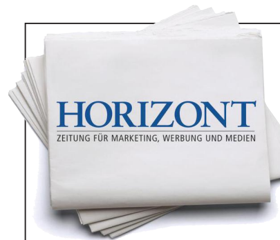
ILLUSTRATION: JANEI ROBOT / FOTOLIA

REPORT: Die Pläne der Werber und viele Schweizer Themen mehr. 33–52