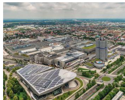
BILD PLUS: Timo Lokoschat und Lars Moll über Meilensteine und Wachstum. 16