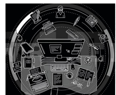
ILLUSTRATION: CONCEPT ART BY PRINTERMEDIA / ANAGO IMAGES

WERBEGESCHÄFT: Amazon rüstet auf und treibt damit die Konkurrenz an. 10