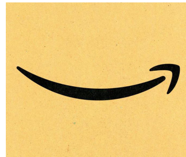
ILLUSTRATION: CLAUDIO PIVOLA / PARTHENONEDIA, JAMACO IMAGES