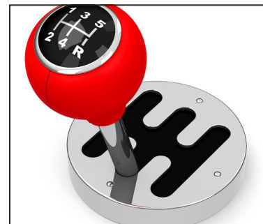
ILLUSTRATION: BERNARDINI / FOTOLIA