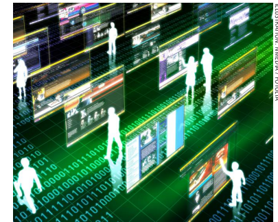
ILLUSTRATION: ANDEKA

JICS: Die Aufgaben sind komplex, ihre Lösung nebulös. Wie geht es weiter? 12