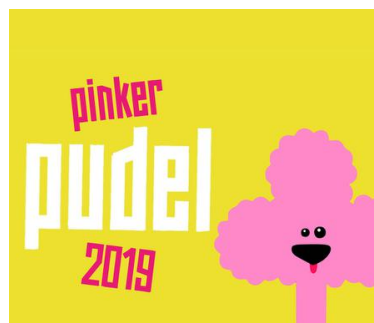
ILLUSTRATION: PINKER PUDEL

SNOWMASTERS: Marketing im Schnee – mit HORIZONT unterwegs. 15/30