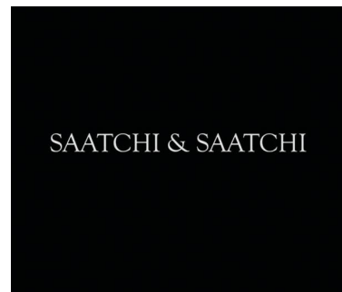
ABBILDUNG: SAATCHI & SAATCHI

LIDL: Wie Martin Alles die internationale Kampagne zum Fest steuert. 14