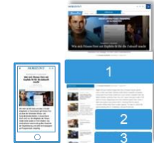
Artikelebene des Specials