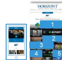
Einstiegsseite des Specials