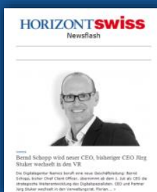
HORIZONT Swiss Newsflash

SWISS Newsline: Versand einmal täglich werktags mit allen wichtigen Branchennews des Tages