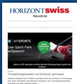
HORIZONT SWISS Newsline