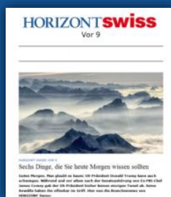
HORIZONT SWISS Vor 9