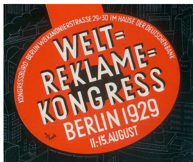
ABBILDUNG: JOSEF KOCH / QUELLE: ALS DIE WERBER CHARLESTON TANZTEN

BRILLEN: Warum Mister Spex den stationären Handel für sich entdeckt. 15