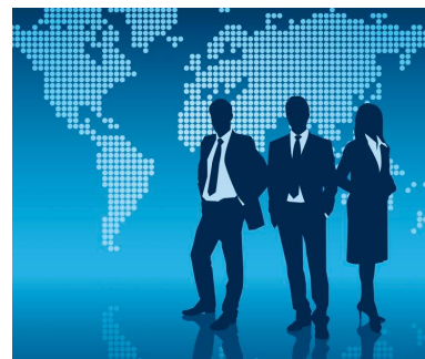
ILLUSTRATION: AG VISUELL / FOTODIA

WORT & BILD: Die Auflage des Kundenmagazins steigt gegen den Trend. 13