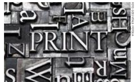
WIKIDAT: FRIEDRICH GLOU