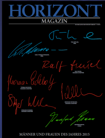
Abbildung von 2016