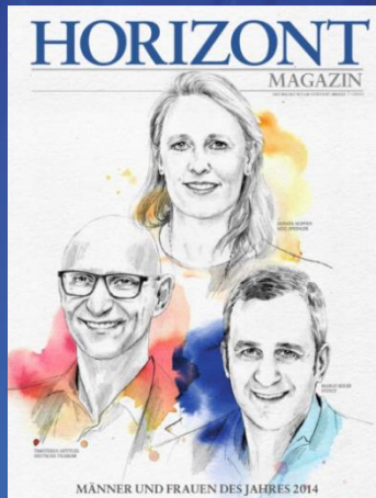
Abbildung von 2015