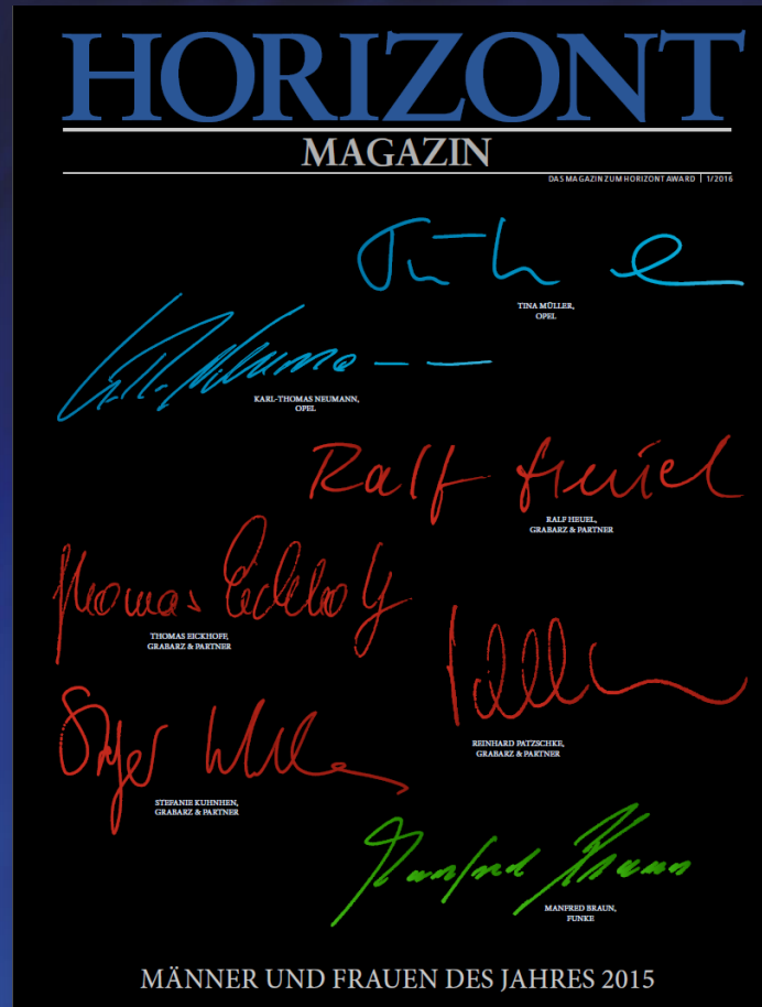
Abbildung von 2016